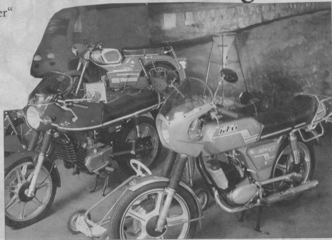
Im Automobil- und Spielzeugmuseum Nordsee an der Ostermarscher Straße zeigen die Kreidlerfreunde aus Norden einen Teil ihrer Fahrzeuge.

Um 17 Uhr macht sich ein Bus vom Doornkaatgelände aus auf den Weg zum Automobilmuseum an der Ostermarscher Straße. Dort ist die Sonderausstellung „Faszination Kleinkrafträder“ für die Öffentlichkeit zugänglich. Danach werden die für die